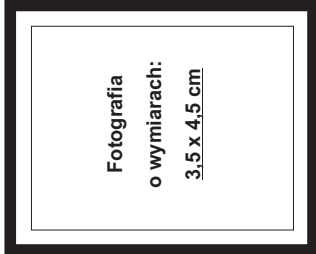
(nie wykraczać poza ramkę wewnętrzną)